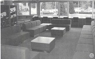
くつろぎコーナーで、どうぞごゆっくり

図書館は、ふれあいの場なのです。そのために利用者、つまり、あなた一人ひとりがお考え下さいと思います。