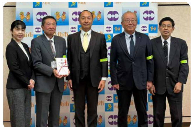
浅尾教育長と成田法人会の皆さま