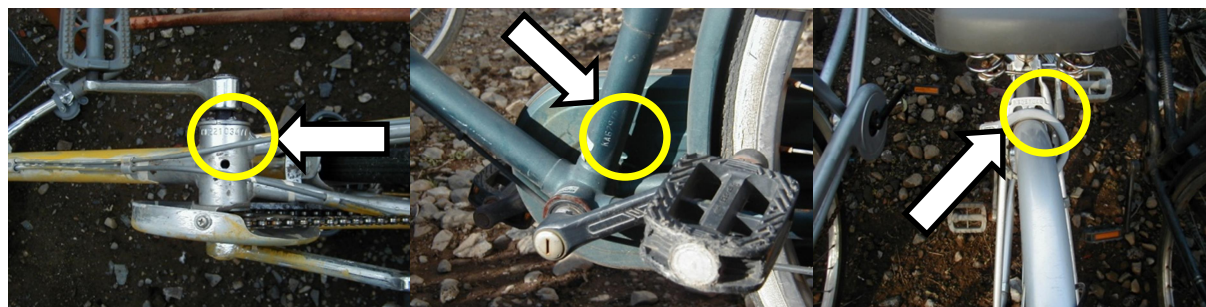
④ペダルの取り付け部分 (下から見たところ)