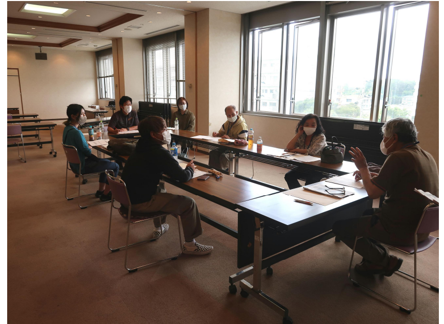
意見交換会の様子