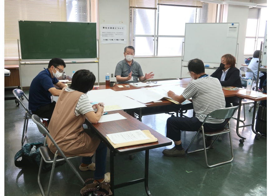
グループワーク（空き家の活用チーム）の様子