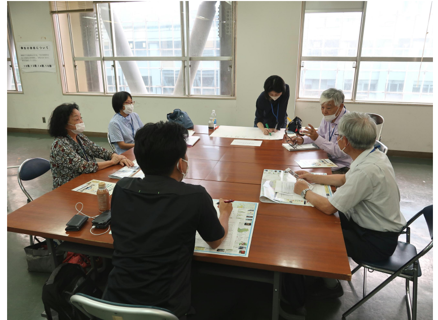
グループワーク（地域活性化イベントチーム）の様子