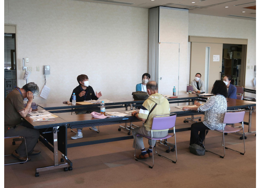
意見交換会の様子