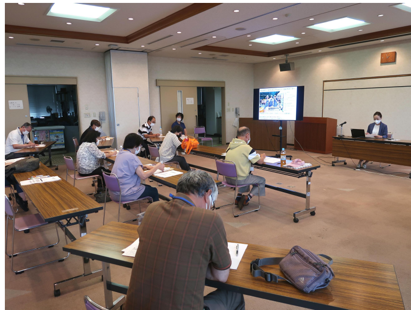
小藪氏による事例発表の様子