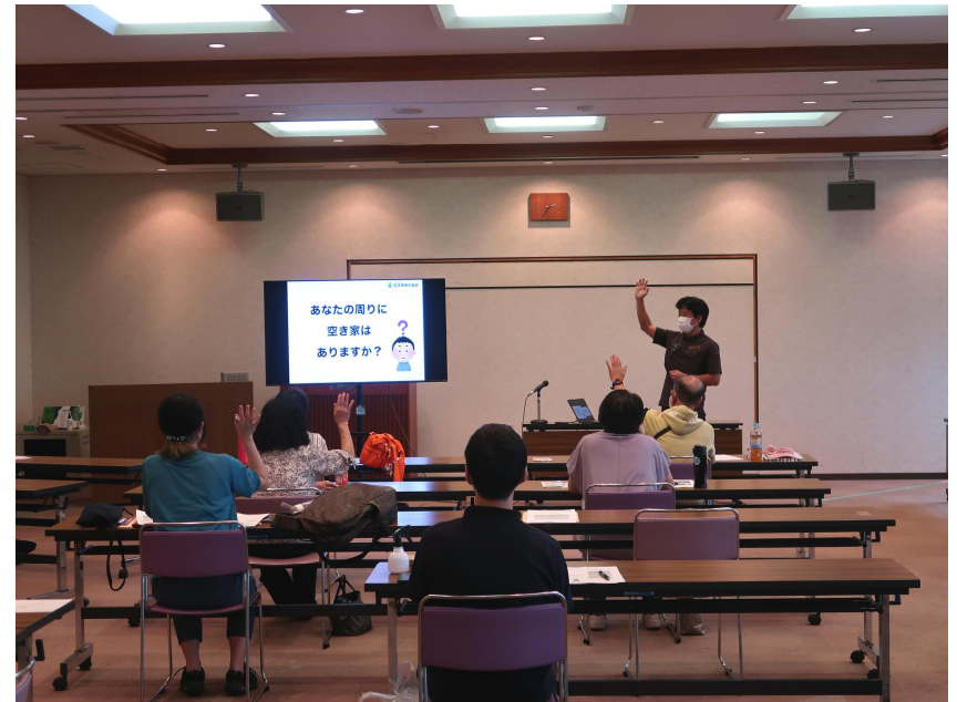
菊池氏による事例発表の様子