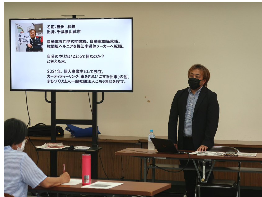
豊田氏による講義の様子