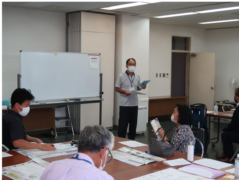
地域活性化イベントチームの発表