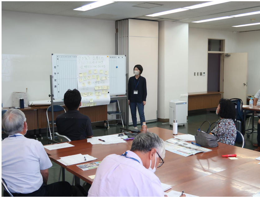
空き家の活用チームの発表