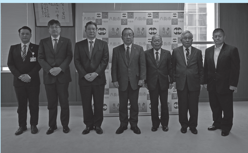
贈呈式に出席された皆さまと北村市長