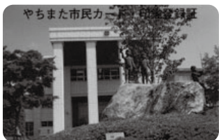
やちまた市民カード・印鑑登録証

自動交付機で利用されていた「やちまた市民カード・印鑑登録証」は、自動交付機のサービス終了後も窓口で印鑑登録証明書を取得する際に、必要となりますので、引き続き大切に保管をしてください。