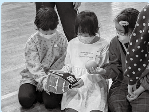
交進小学校での様子