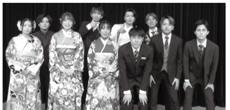
第2部 実行委員の皆さん