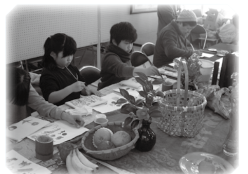
こうみんかん祭の様子