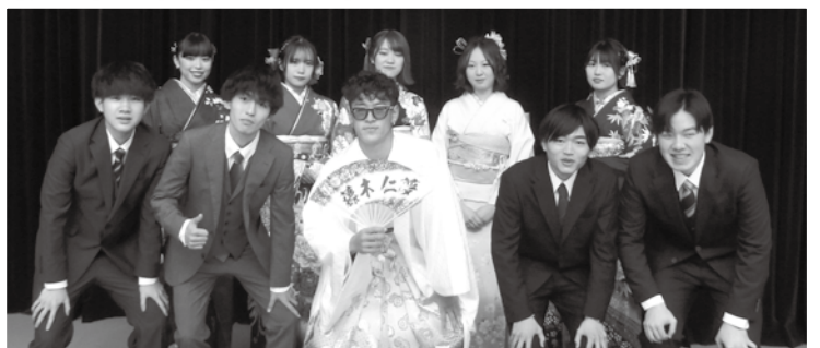
第1部 実行委員の皆さん