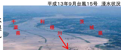
大雨時の下水、河川への集中流出の抑制

ダム等の水源を温存し、渇水時の被害を軽減する効果や災害時等の緊急用水としての利用が期待されます。