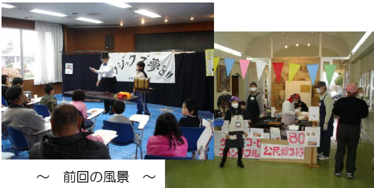
～ 前回の風景 ～

※都合により内容等変更になる場合があります。 ※当日は、駐車場の混雑が予想されますので、公共交通機関をご利用ください。