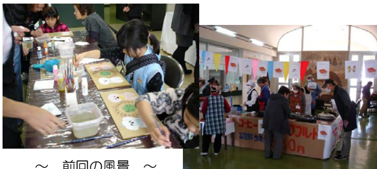
～ 前回の風景 ～

そば、手作り品などの販売(数には限りがあります) やきそば、五目ごはん、フランクフルト、コーヒーなど