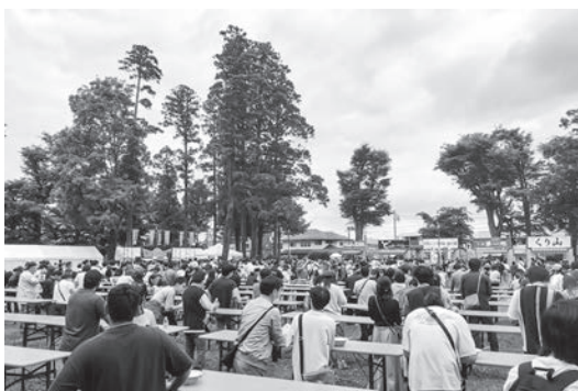
▲ラーメン祭が開催され、多くの来場者で賑わいました。

のラーメンイベントが、本市のPRに大きく寄与し、近隣の商店街にも多くの皆様が訪れ、地域経済にも波及効果がありました。八街市のPR大使「落花生娘」を発足、任命し、ラーメン祭を盛り上げて頂き、今後も本市のPRをして頂けますよう商工会議所とともに可能な限りの協力をしていきます。