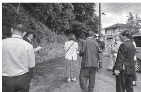
▲土砂災害警戒区域の現地視察を行いました。