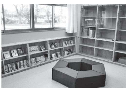
▲八街市児童館「ひまわりの家」

問 現実の居場所だけではなく、オンライン上やメタバース(仮想空間)での居場所は。