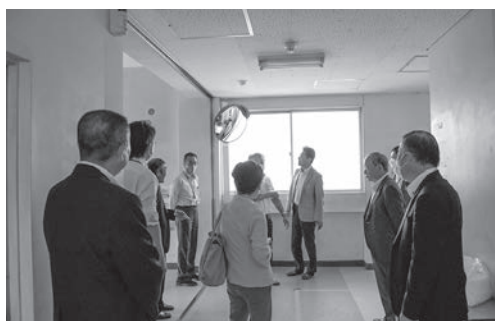
▲SPS認証校の朝陽小学校等の視察を行いました。