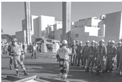
▲八街市消防団の活動

答 茨城県や埼玉県などで実施されており、出会いの有効な手法と考えます。先進事例のとおりに都道府県単位での広域的な実施が有効であるため、千葉県で同様の取り組みがあれば、市民の参加を積極的にサポートしていきます。