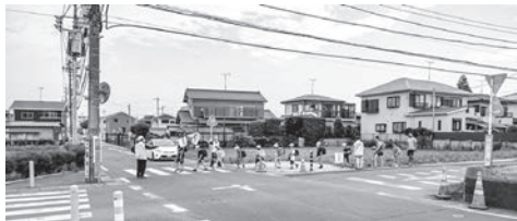
▲登校時の二区「竹内十字路」

答 警察との協議とそれに基づく詳細設計が完了し、道路拡幅部分が確定した後、用地の測量、取得の事業に着手していき