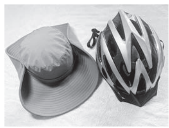
▲自転車用ヘルメット