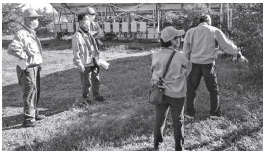
▲農業委員会の現地視察の様子