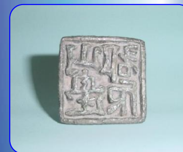
重要文化財「山邊郡印」(複製品)