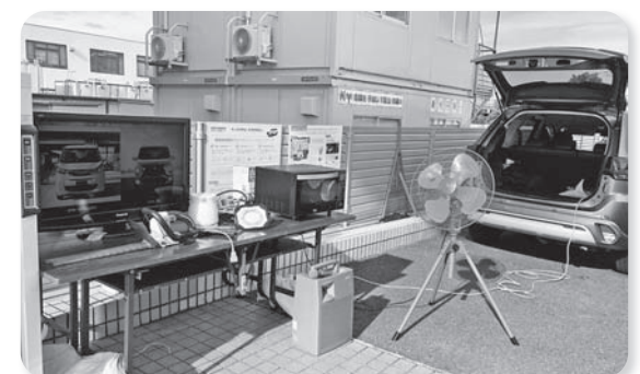
災害支援車から電気を送っている様子