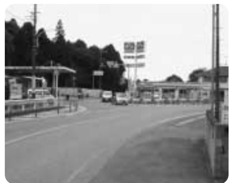
スリーエフ八街吉倉店付近

問 市内の今後の上水道整備の見通しはどうか。 市長 経営状況等を勘案し整備を図りたいと考え、独立採算の経営原則を踏まえ、