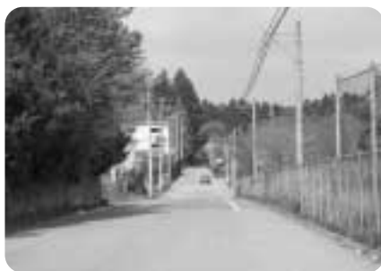
▶高圧ナトリウム灯が設置された南中前