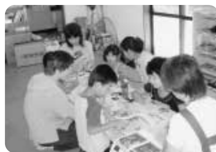
▶交進児童クラブの様子

を40名とし、平成18年6月に開設の予定です。なお、待機児童のいる朝陽児童クラブは、待機児童解消を図るため、隣接地である元朝陽教職員住宅の1棟を改修して、定員を30名から60名として、平成18年7月の開設を予定しています。