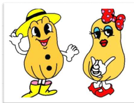
ピーちゃん ナッチちゃん

八街の豊かなピーナッツ畑の生まれ。黄色い麦わら帽子と長靴がお気に入りのピーちゃんと、赤いリボンと靴がお気に入りでおしゃれが大好きなナッチちゃんは恋人同士。二人はいつも一緒に八街とピーナッツの PR に努めています。