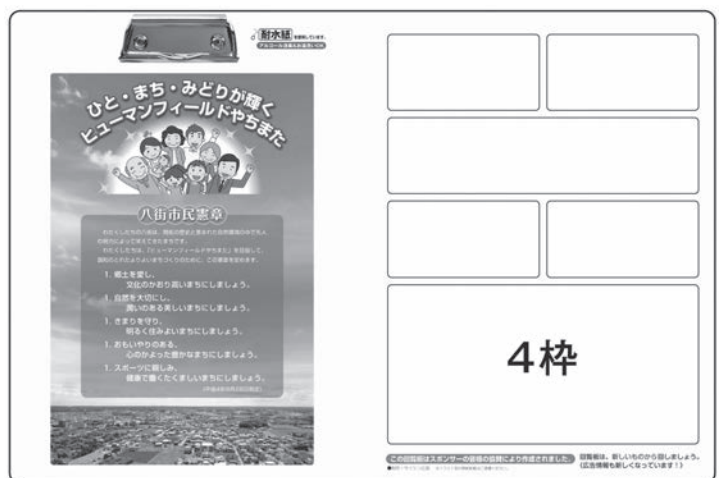
< 中面 >

※掲載サイズ・位置などは先着順となります。 ※広告枠がすべて埋まり次第、募集を終了します。 ※デザインは一部変更になる場合があります。