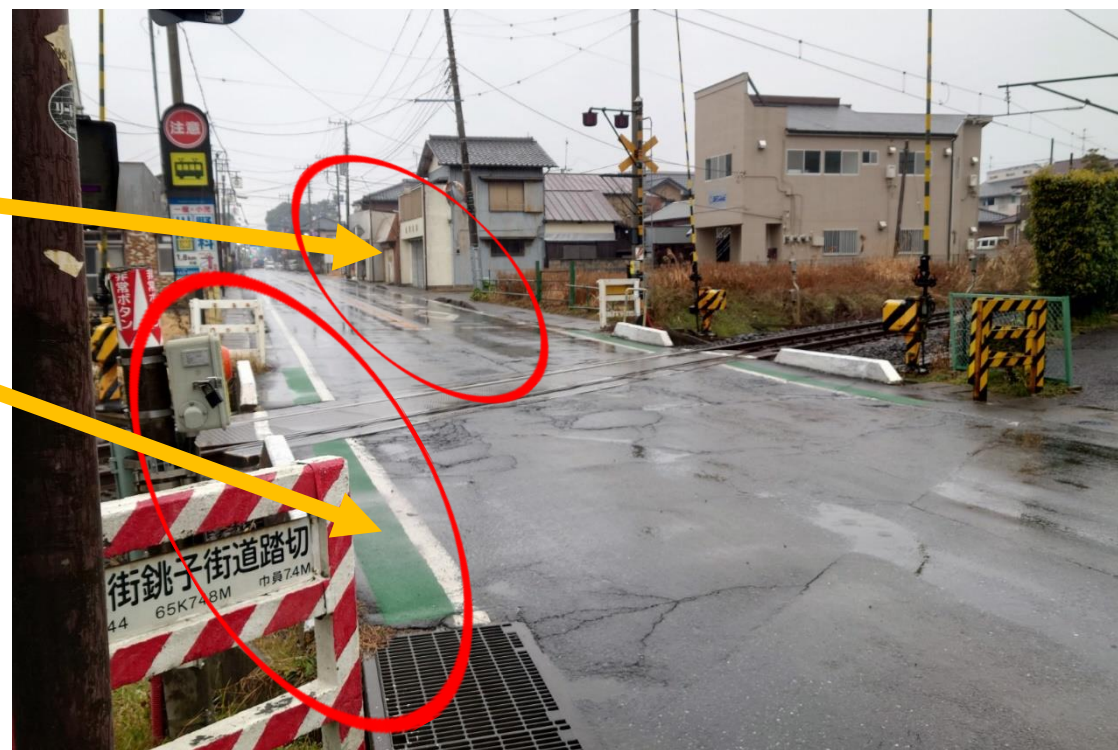
グーグルマップ (Webシステム)